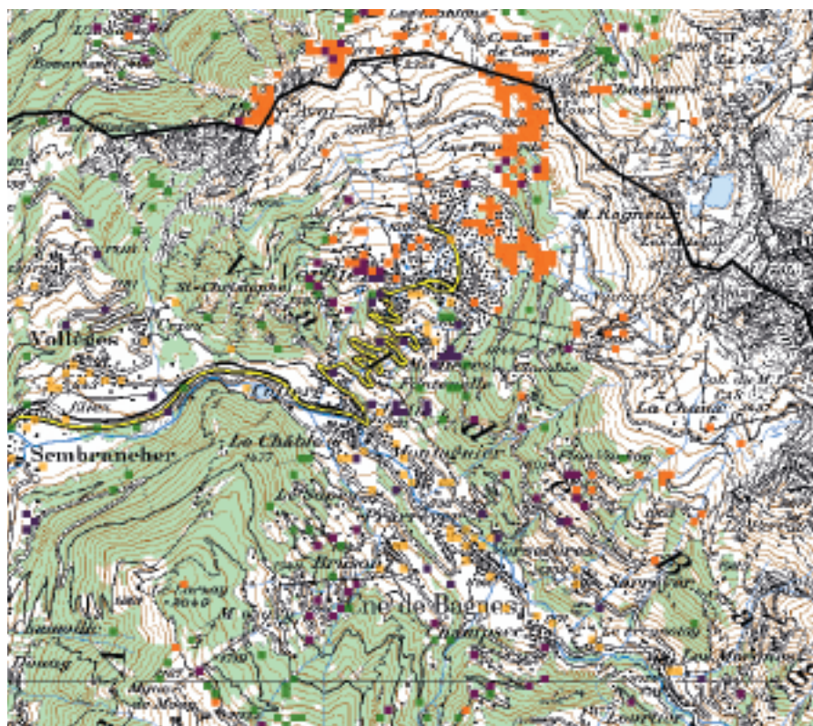
Fig. 1. Disparition des surfaces agricoles et progression du boisement en moins de vingt ans dans la région du Châble et de Verbier, d'après les statistiques suisses de superficie de 1979/1985 et 1992/1997. A basse altitude, l'urbanisation prend place dans la SAU. A l'étage des mayens, les zones ouvertes se boisent rapidement en cas de sous-exploitation ou d'abandon. Dans la zone subalpine, différents types de végétation s'installent à la place des pâturages.

L'évolution de l'agriculture dans les deux districts retenus (Entremont et Hérens) se caractérise par une très forte diminution des exploitations ces vingt dernières années (près de 70%) tandis que la surface agricole ne diminuait que de 6 à 9%; cela indique un fort agrandissement des exploitations qui se sont maintenues, et en partie professionnalisées. L'utilisation du sol évolue selon deux tendances principales: