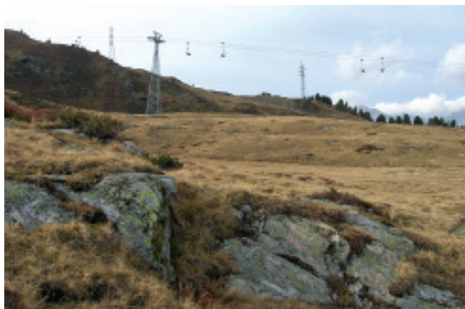
▽ Fig. 3. Paysage à forte valeur économique due à la présence des remontées mécaniques qui excluent toute valeur environnementale. La grande majorité de la population n'apprécie pas ce paysage, mais lui reconnaît des fonctions de loisir et économique importantes, voire vitales.

tiel environnemental est perçu comme un paysage à faible valeur économique et inversement. De plus, un paysage fortement lié à une fonction économique (fig. 3) est généralement peu apprécié.