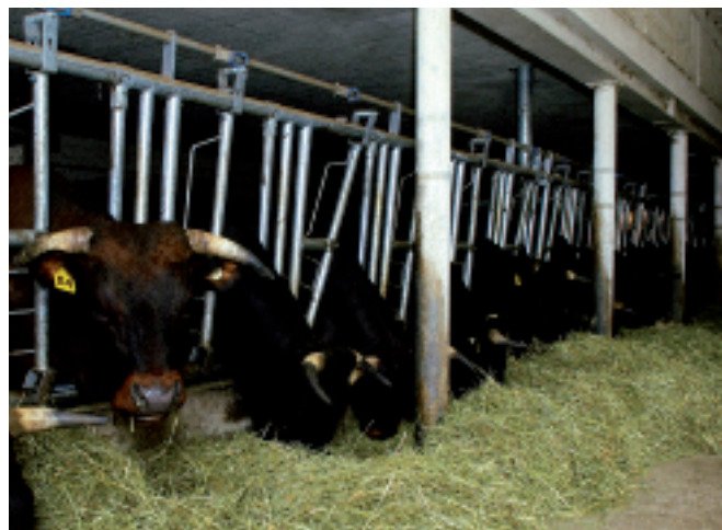
Les animaux du projet à La Frêtaz, en stabulation libre.