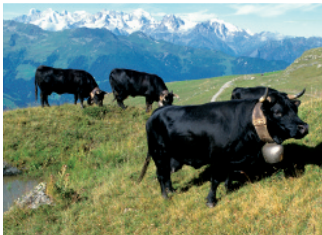
La vache d'Hérens: un symbole identitaire fort.

duit et évalué par les équipes des stations de recherche Agroscope ALP et ACW durant trois années sur les sites de La Frêtaz (VD) et du Larzey (VS). Parallèlement à cette démarche expérimentale, le volet sociologique du projet évalue les possibilités pour les éleveurs d'intégrer ces pratiques. En effet, les