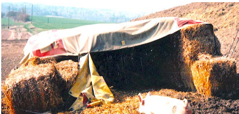
Les abris en paille sont bon marché, mais ne peuvent pas être déplacés