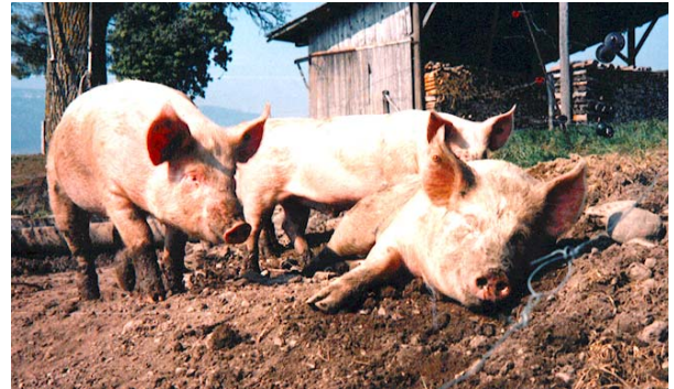
Les porcs en plein air profitent du soleil