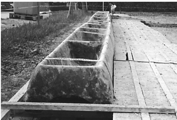
Place d'alimentation de porcs en plein air