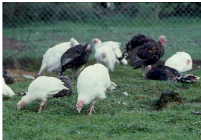
L'alimentation est de préférence automatique

Le chant des sources Sàrl, Jacques Hofer, Ferme Avicole, 1400 Cheseaux-Noreaz [vente directe]