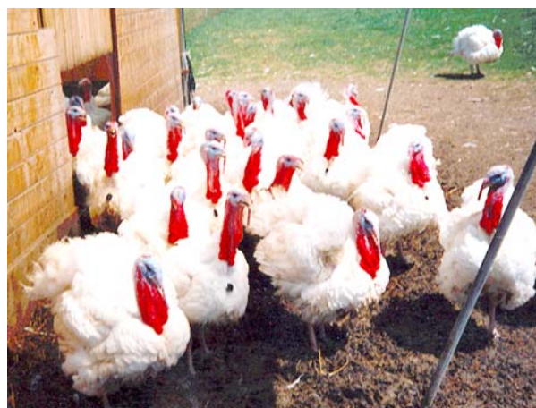
Des dindes en plein air