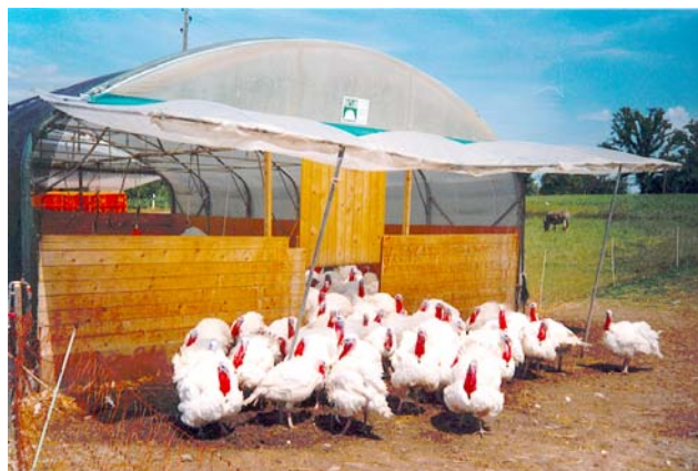
Cette serre est facilement déplaçable